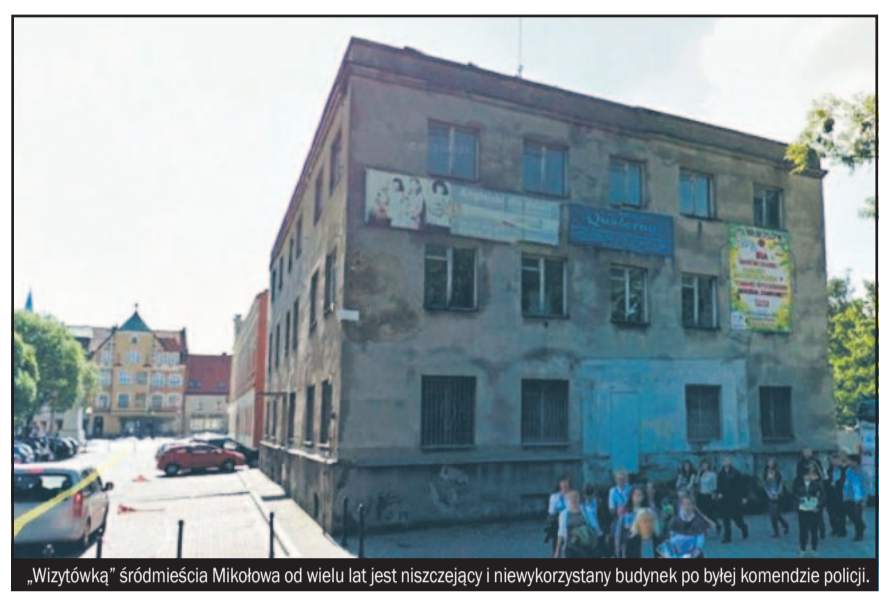
„Wizytówką” śródmieścia Mikołowa od wielu lat jest niszczący i niewykorzystany budynek po byłej komendzie policji.