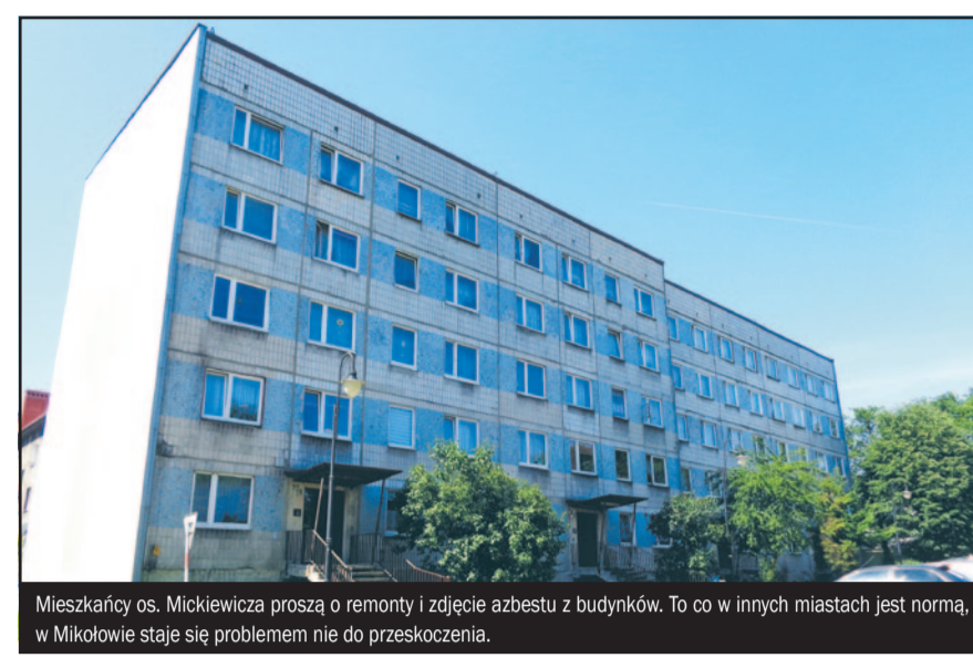
Mieszkańcy os. Mickiewicza proszą o remonty i zdjęcie azbestu z budynków. To co w innych miastach jest normą, w Mikołowie staje się problemem nie do przeskoczenia.