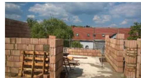
w trakcie realizacji